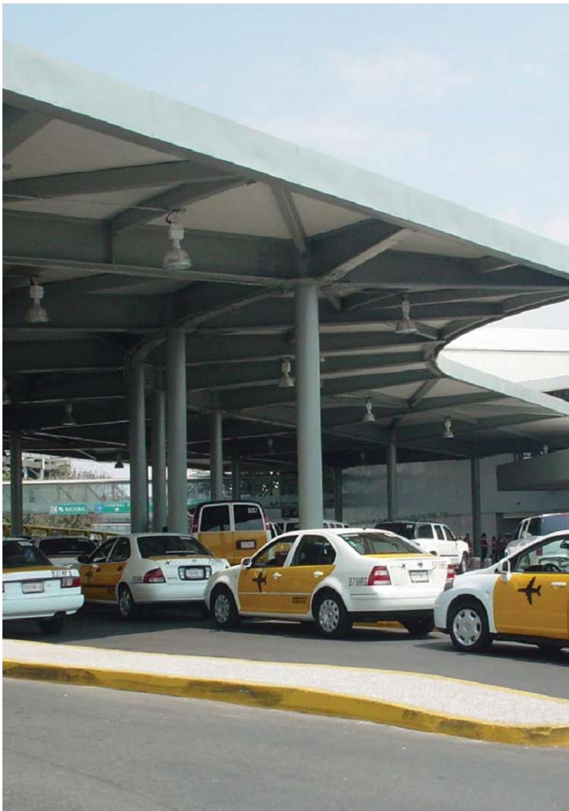
Aeropuerto Internacional Benito Juárez de la Ciudad de México (AICM). Construcción del paso a cubierto y obras exteriores del acceso a T1