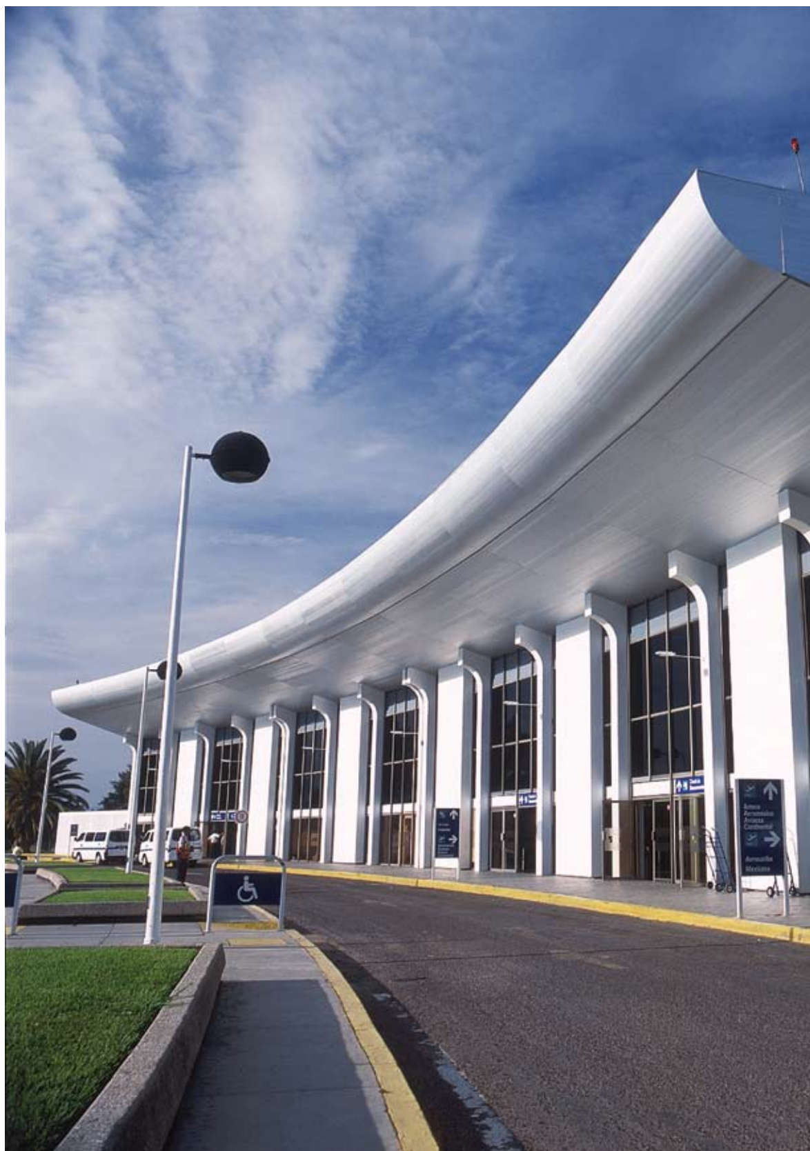
Aeropuerto Internacional de Oaxaca, Oax.