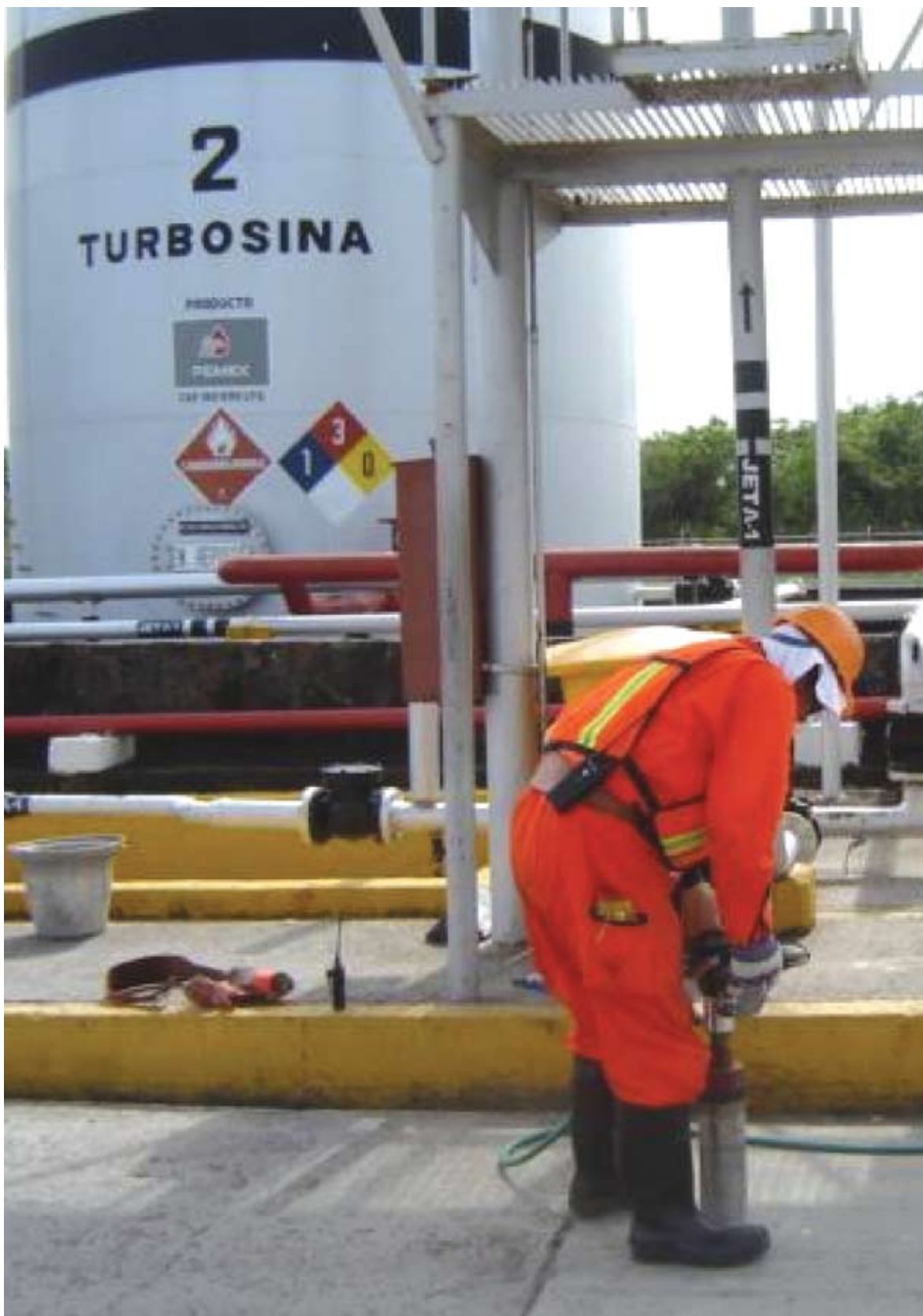
Aeropuerto de Veracruz, Ver. Caracterización y remediación de suelo