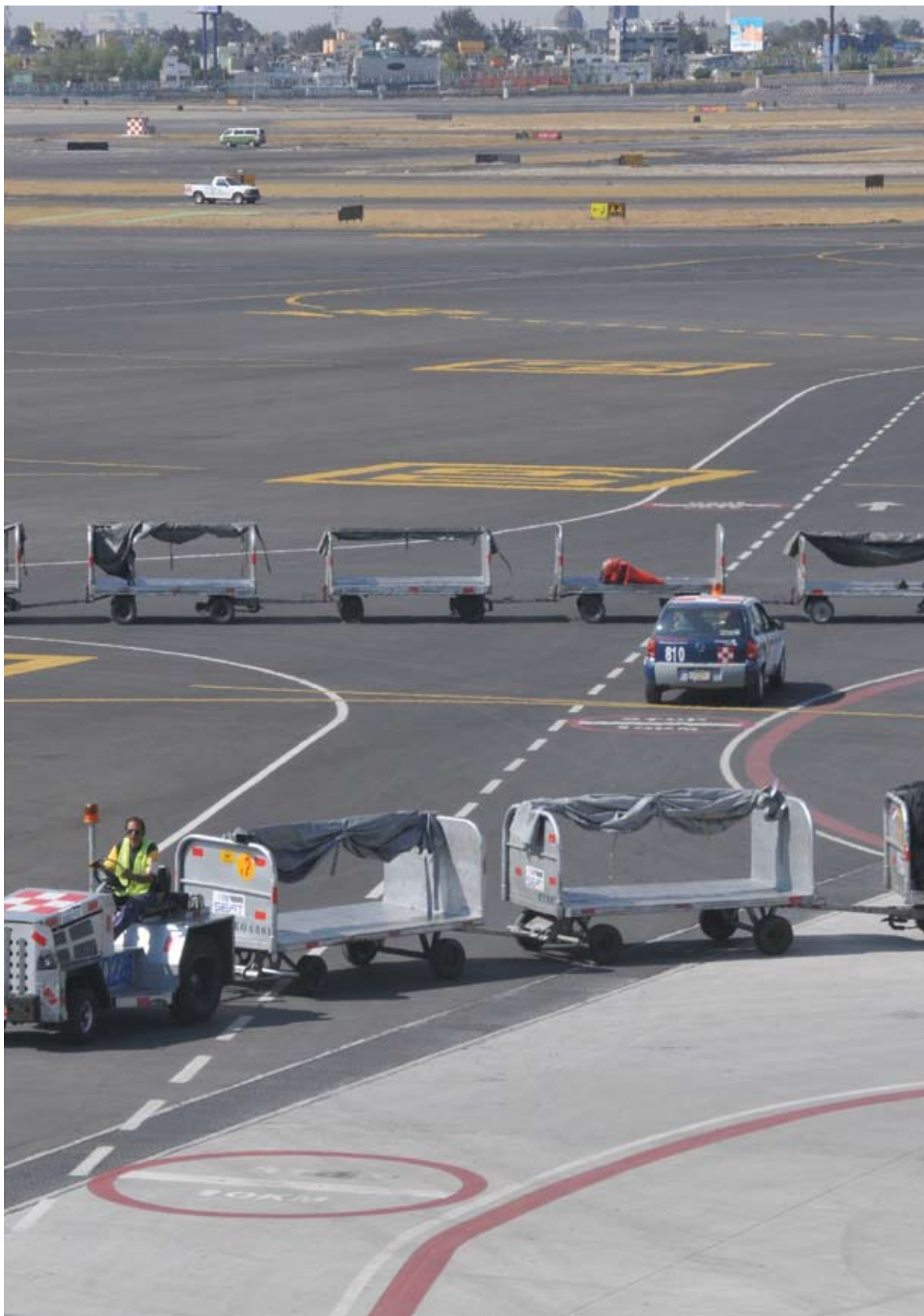
Aeropuerto de Tijuana, Baja California. Modernización del sistema contra incendios en la estación de combustible