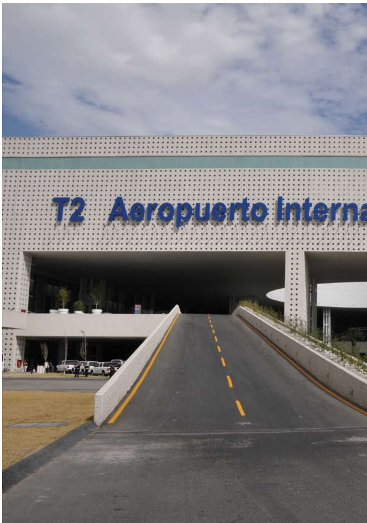
Rampa de acceso a la T2