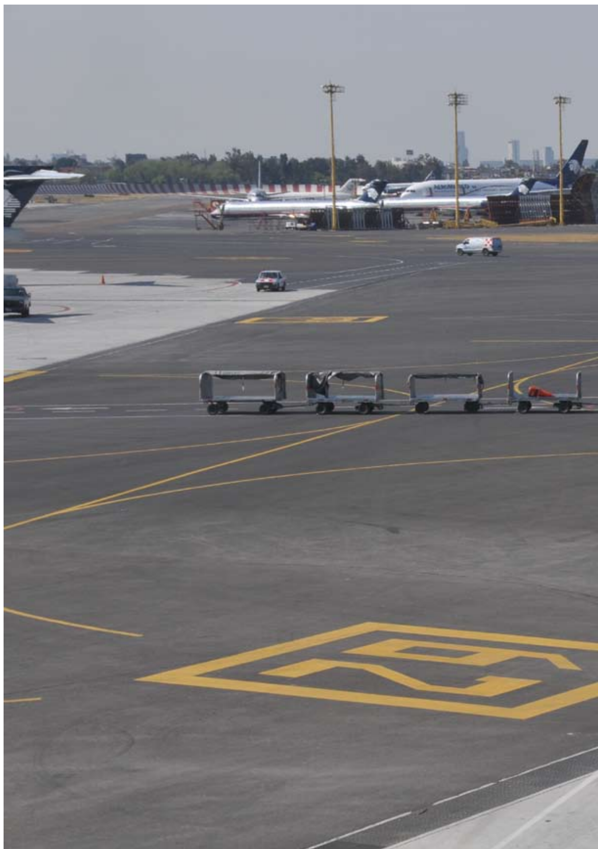
Aeropuerto Internacional Benito Juárez de la Ciudad de México (AICM). Señalamiento horizontal en pavimentos de concreto hidráulico en plataforma de la Nueva T2