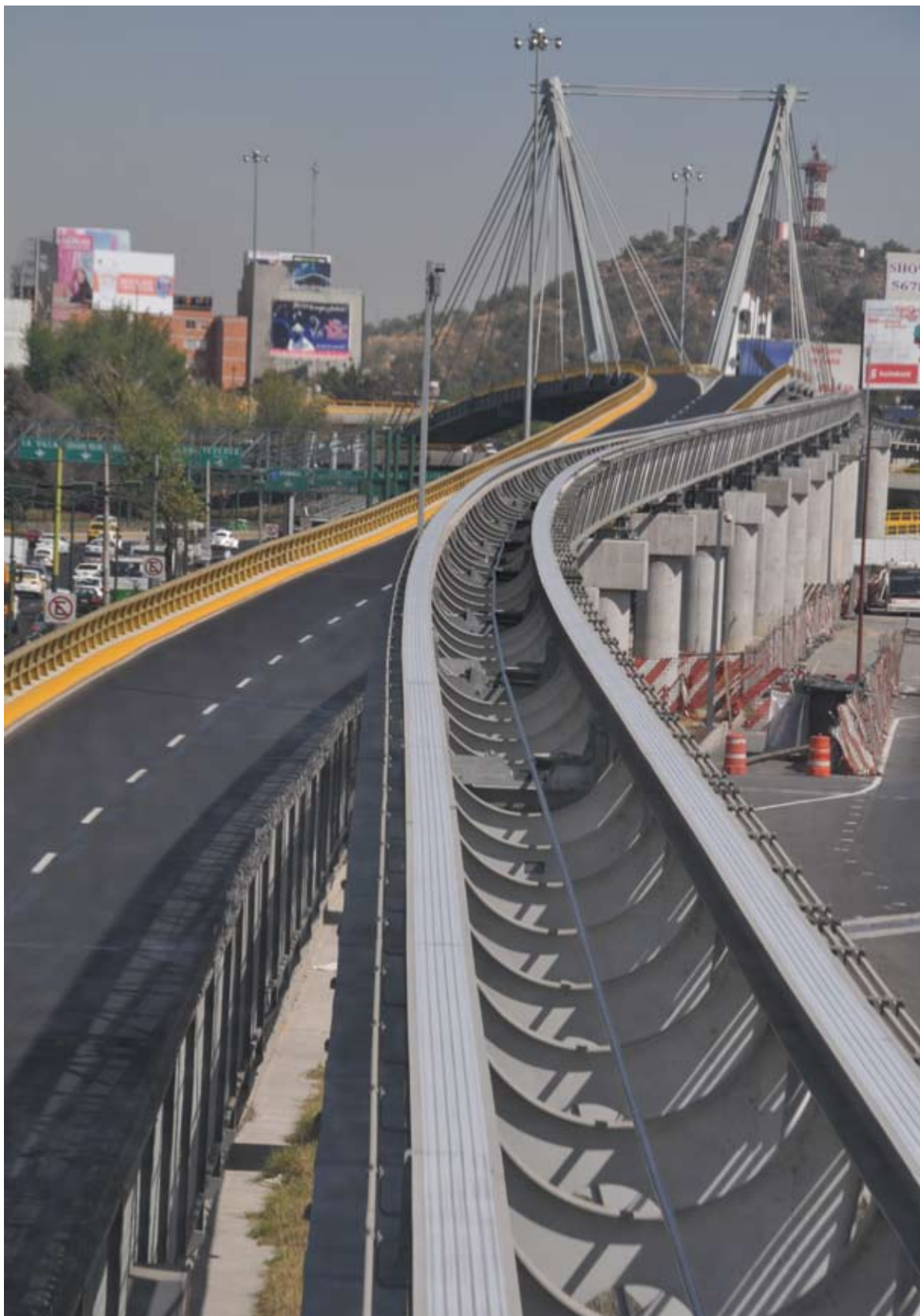
Aeropuerto Internacional de Oaxaca, Oax