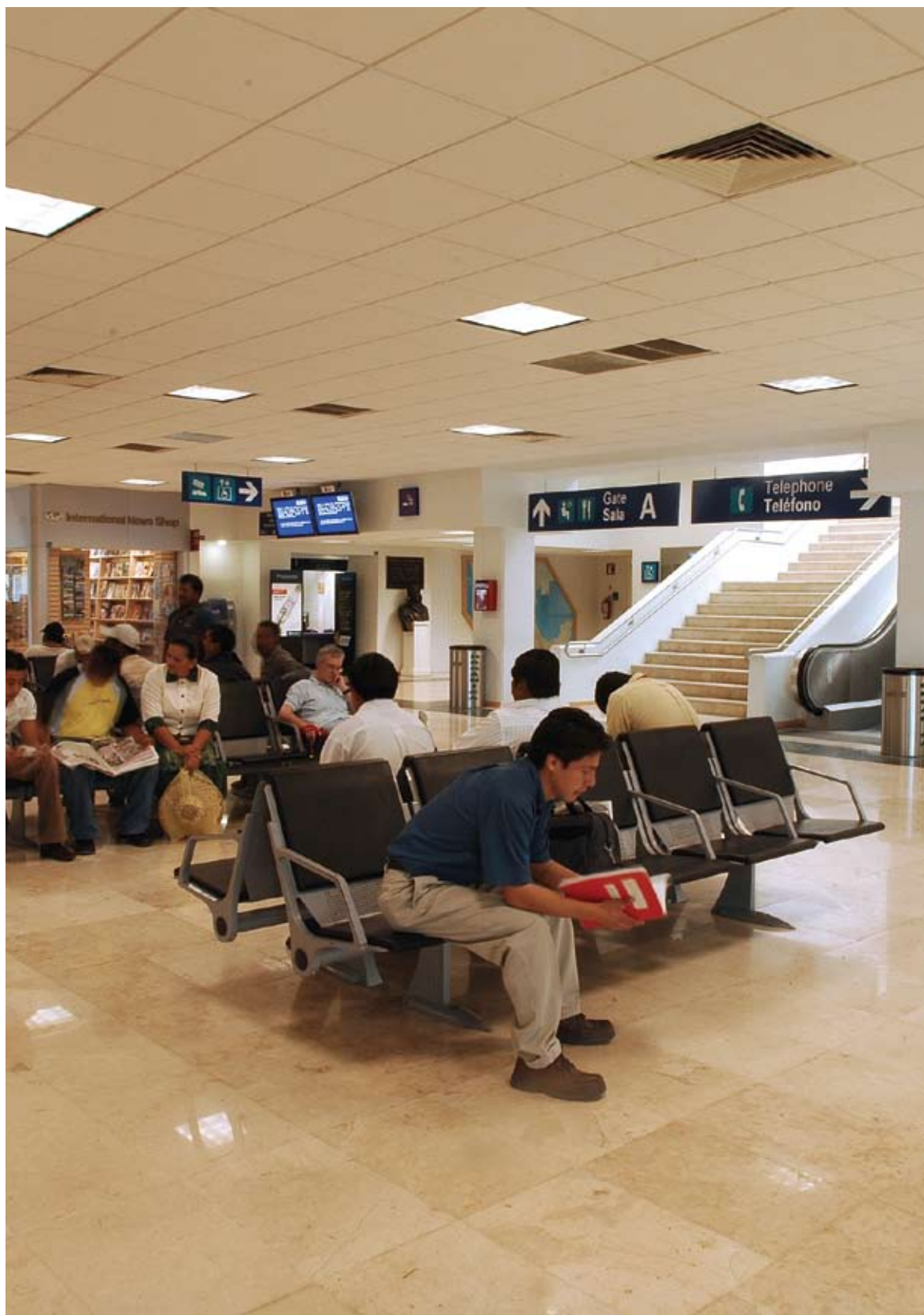
Rampa de acceso a la T2