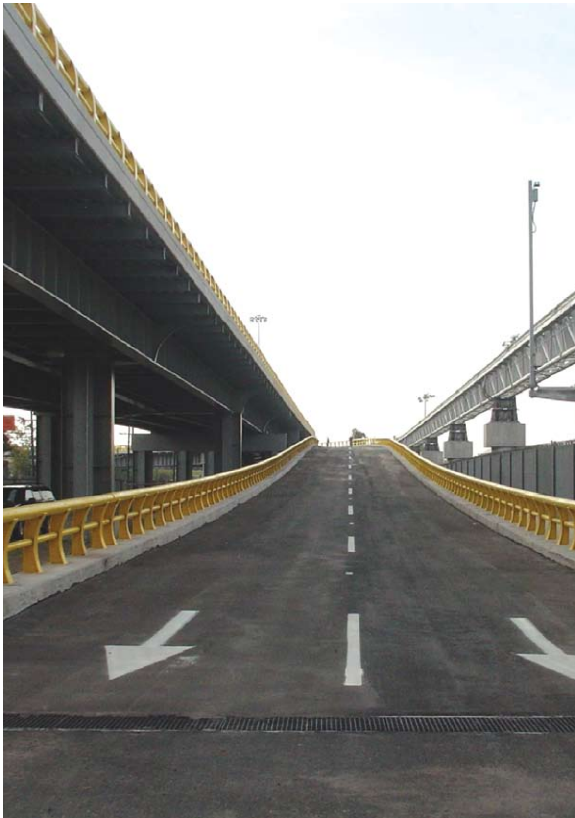
Aeropuerto Internacional Benito Juárez de la Ciudad de México (AICM). Construcción del Distribuidor Vial D2 y la vialidad a desnivel sobre Calle 47 y Economía de Viaducto Río de la Piedad a Eje 1 Norte para la Nueva T2