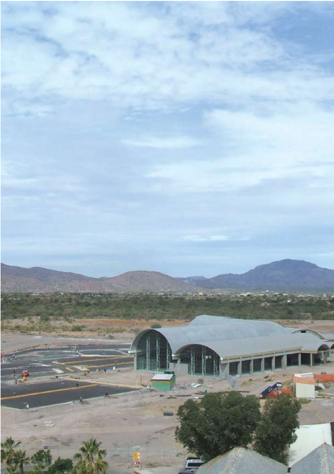
Aeropuerto de Loreto Baja California Sur. Construcción del nuevo edificio de pasajeros (1° etapa)