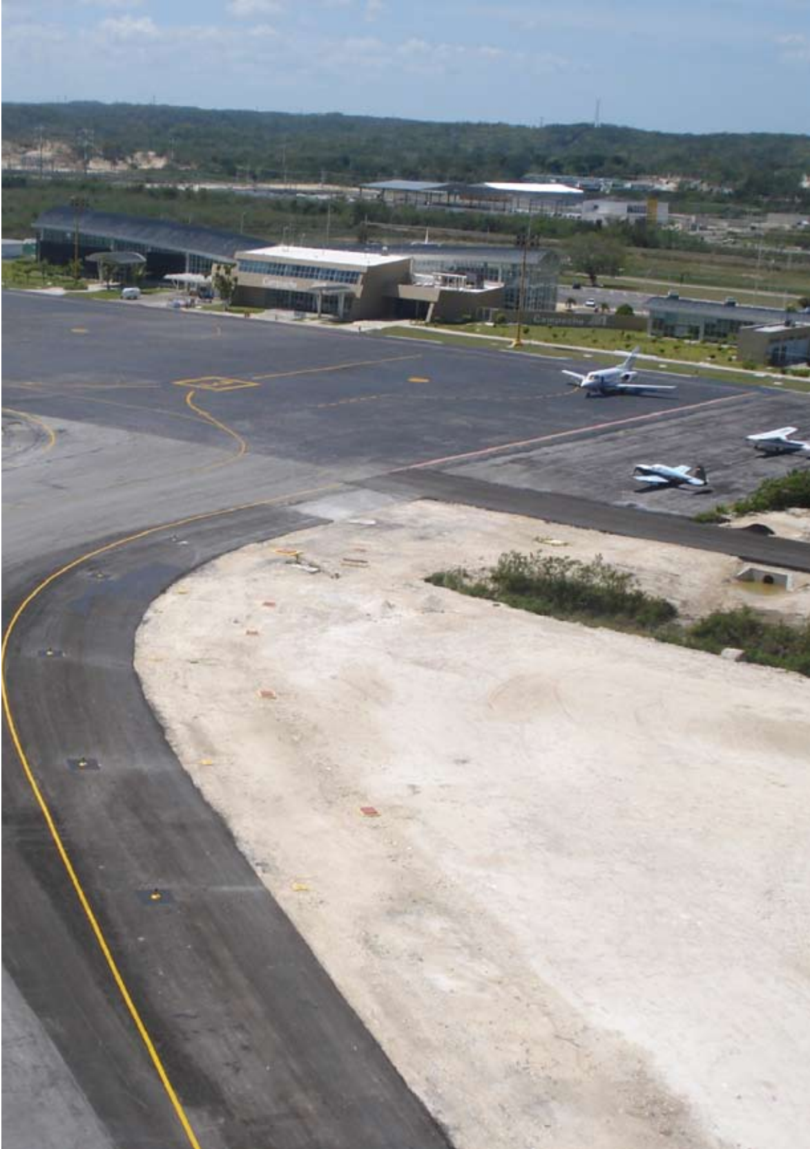
Aeropuerto de Campeche, Camp. Construcción de superficie de enlace en el rodaje hacia la plataforma y construcción de rodaje hacia hangares