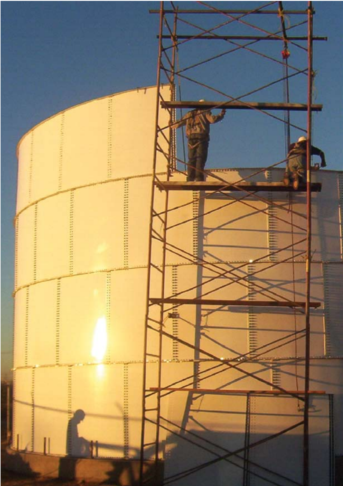
Aeropuerto de Tijuana, Baja California, Modernización del sistema contra incendios en la estación de combustible