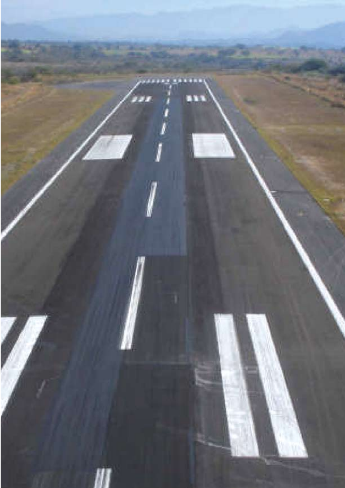
Aeropuerto Colima, Col. Corte de carpeta asfáltica en pista y obras complementarias