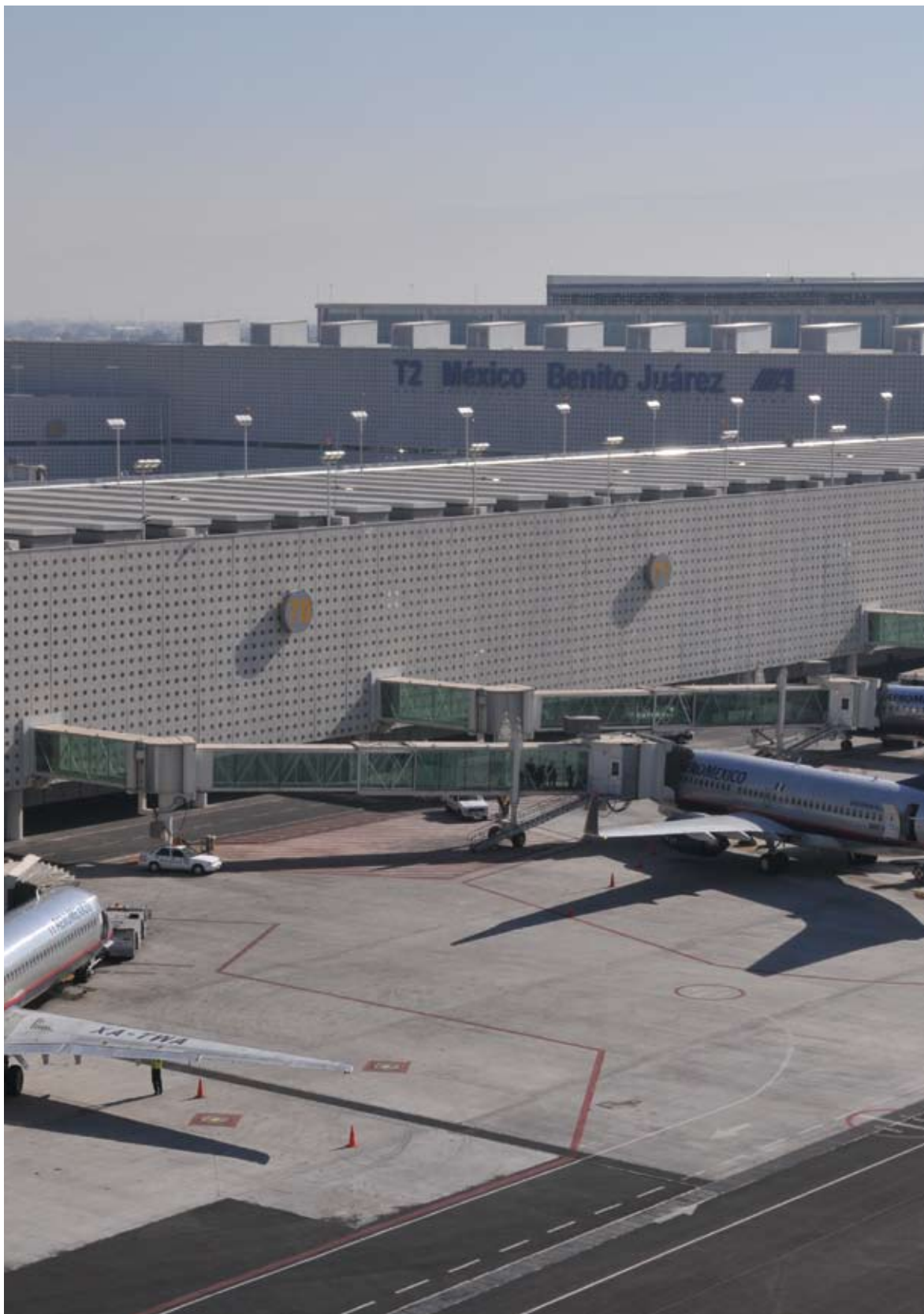
Aeropuerto Internacional Benito Juárez de la Ciudad de México (AICM), Nueva T2