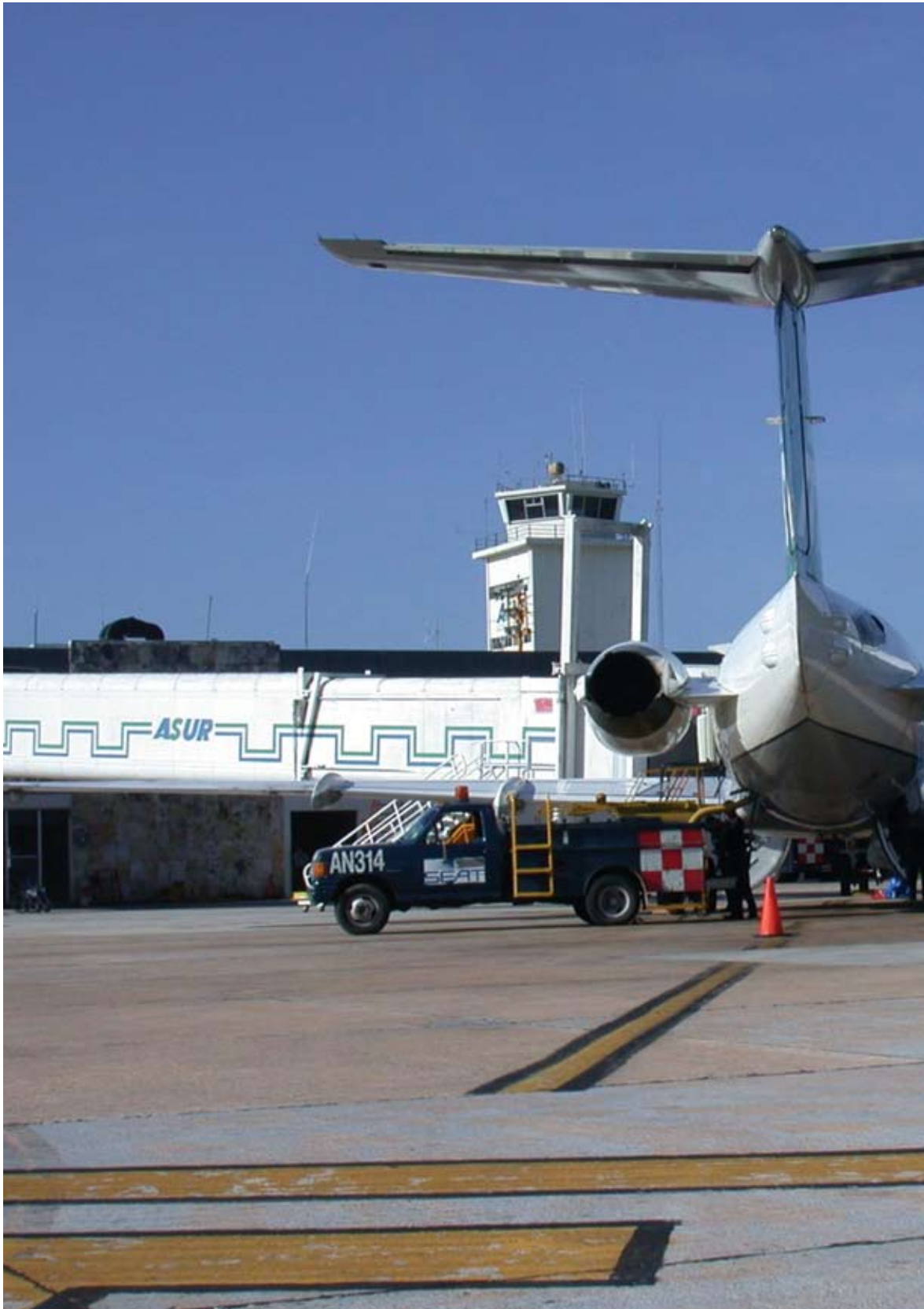
Aeropuerto Internacional de Oaxaca, Oax