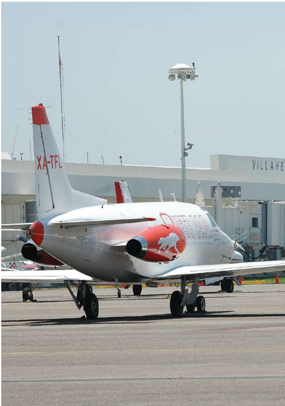
Aeropuerto Villahermosa, Tab.