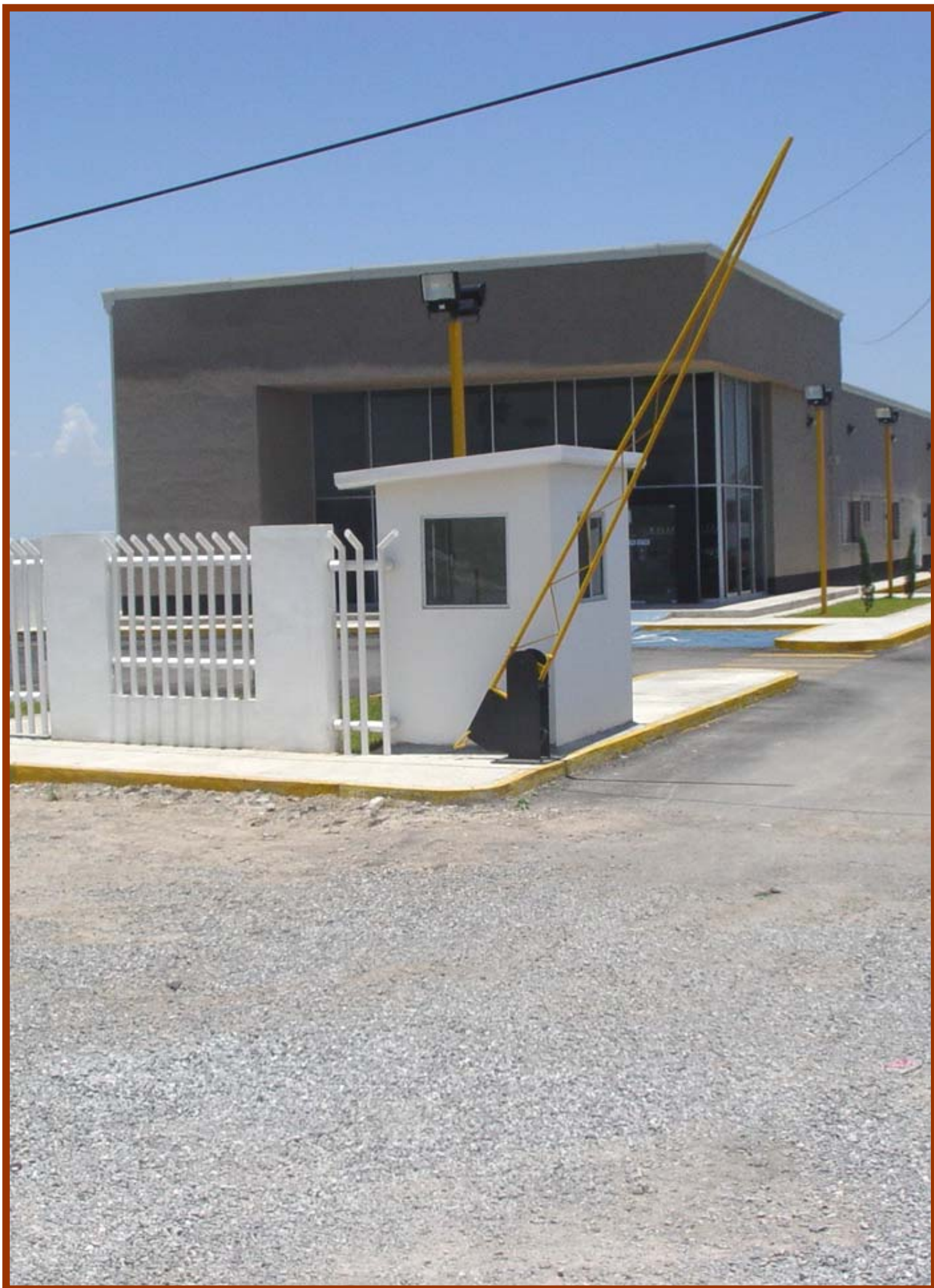
Construcción del Departamento de Autotransporte Federal en Monclova, Coah.