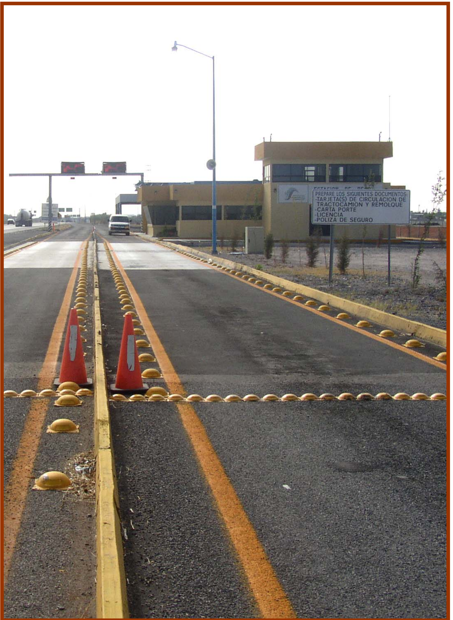
Reparación de plataformas para instalación de básculas en el Centro de Peso y Dimensiones de Calamanda, Qro.