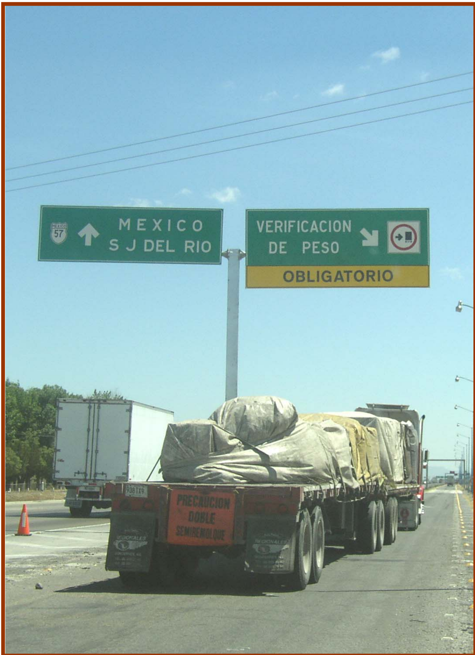
Instalación de señalizaciones en Calamanda, Qro.