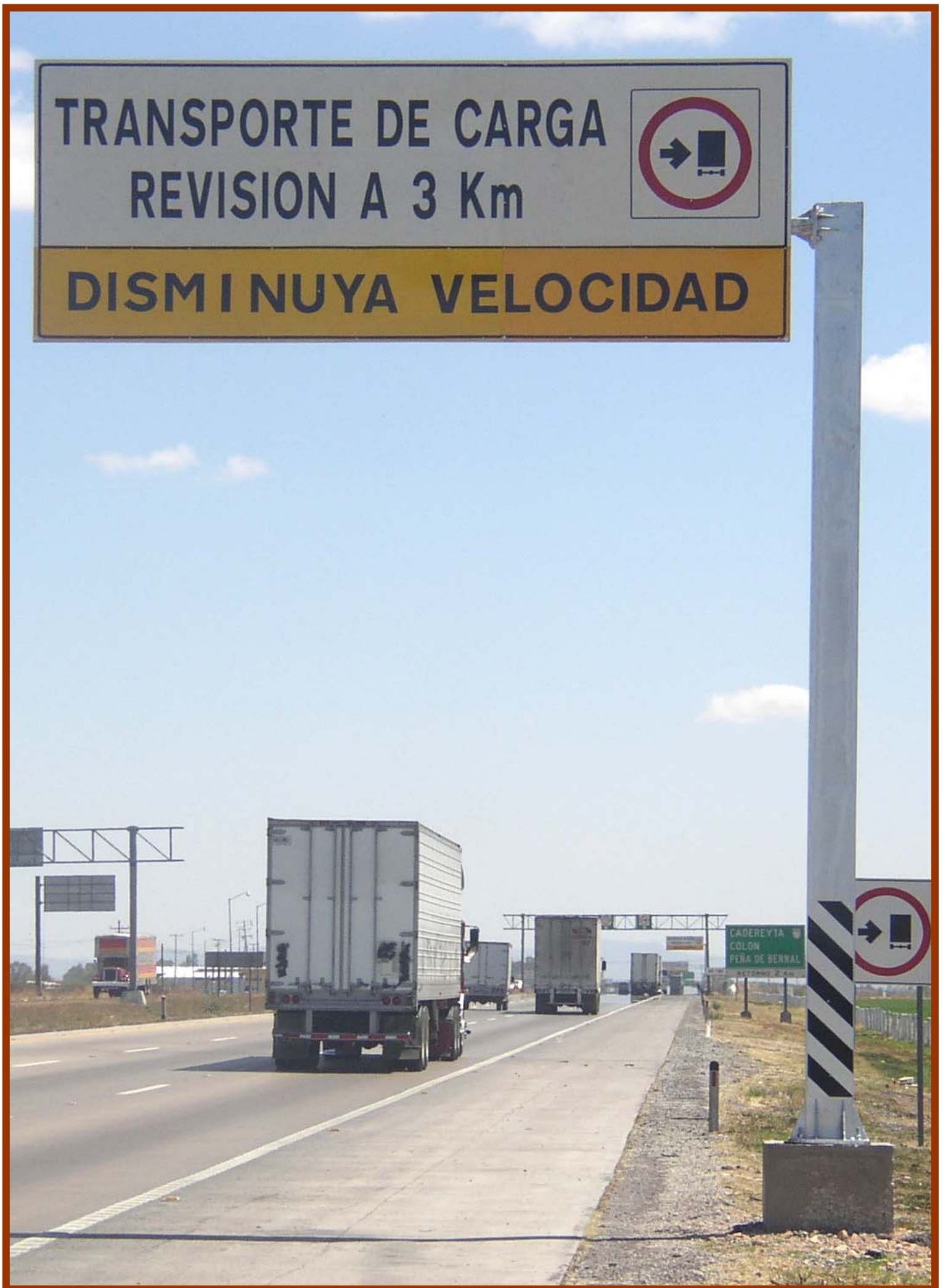
Instalación de señalizaciones en Calamanda, Qro.