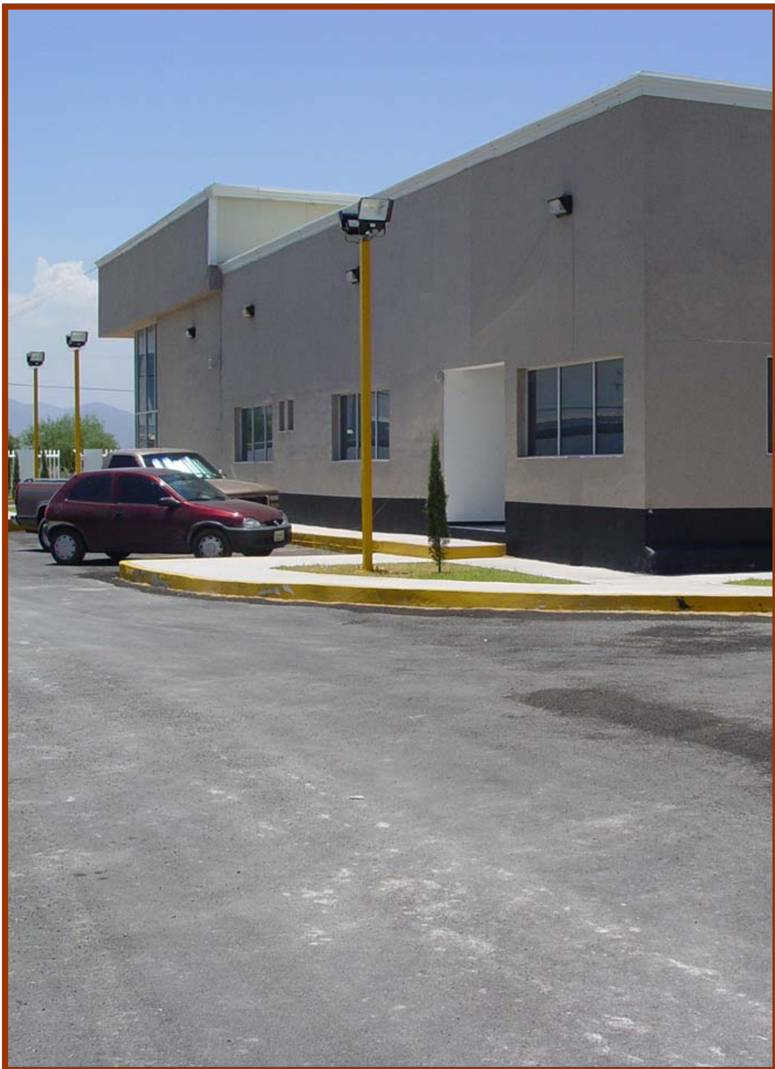
Construcción del Departamento de Autotransporte Federal en Monclova, Coah.