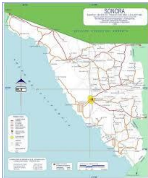
Figura 17. Localización de la Autopista Estación Don-Nogales.

El proyecto de la Autopista Estación Don-Nogales, se localiza en el Norte del país, en el Estado de Sonora.